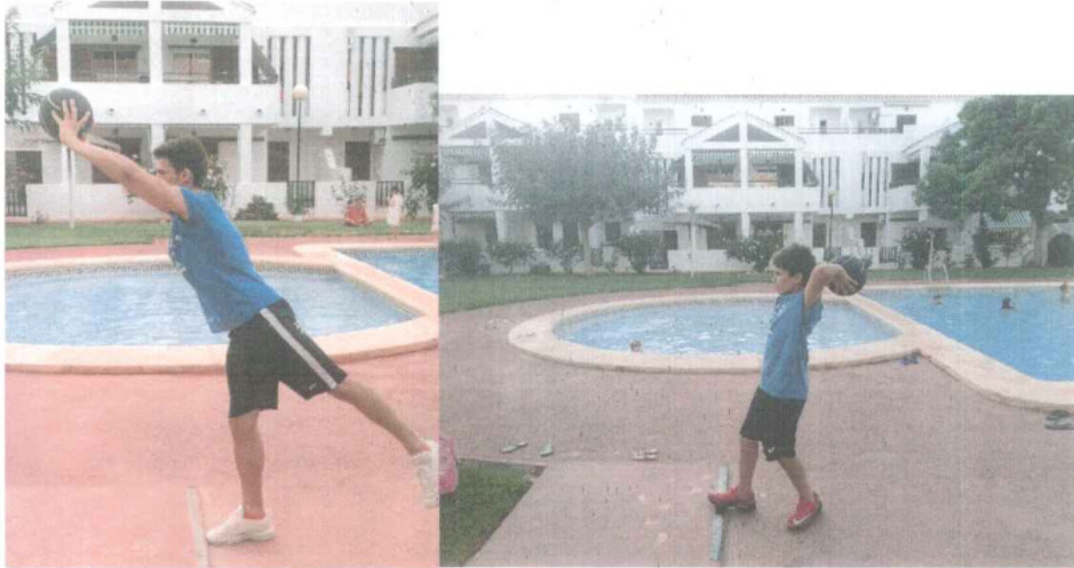
Fotografía 3 y 4